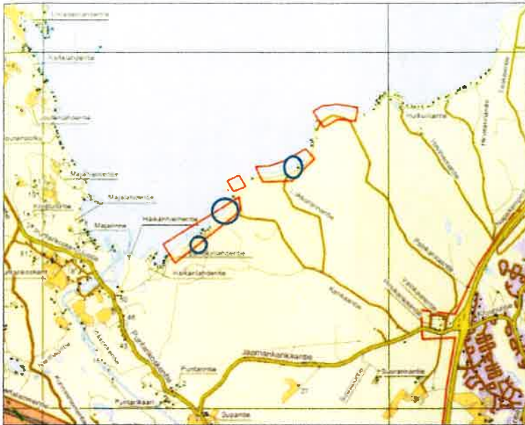
Kuva 1. Voimassa olevan kaavan sijainti punaisella ja muutosten sijoittuminen sinisellä ympyrällä.

Ranta-asemakaavan tavoitteena on nostaa lomarakennuspaikkojen rakennusoikeutta Kontiolahden rakennusjärjestyksen määrittämään 400 x-m 2 sekä tutkia käyttötarkoituksen muutosta osalle rakennuspaikoista. Kaava-alue sijoittuu Höytiäisen etelärannalle Jaamankaankaan alueelle.